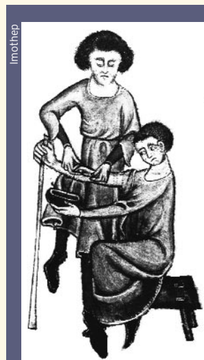
Figure 2 Saigner pour évacuer les humeurs déléterées.

Remarquons que de nos jours, l'influence des chaleurs extrêmes sur les rivières n'est pas exempte d'impact sanitaire: durant l'été 2003 les centrales nucléaires ont rejeté des eaux usées aux températures dépassant les normes, désaturant l'oxygène de l'eau et favorisant le développement de pollution bactérienne.