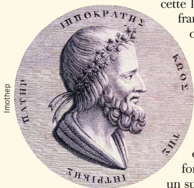
Figure 1 Hippocrate.

A u décours de l'été 2003, la France découvrirait que les chaleurs extrêmes avaient été responsables de 15 000 décès. Au lendemain de ce séisme sanitaire, on exhuma des données bibliographiques passées plutôt inaperçues avant cette épidémie sans précédent*. 1 De fait, peu d'experts français connaissaient cette littérature spécialisée et aucune faculté française, aucun colloque de santé publique ou même diplôme de médecine des catastrophes n'avait inscrit à leurs programmes d'enseignement le thème des effets des chaleurs extrêmes sur la santé des populations. Un manque compréhensible, puisque l'ampleur de la canicule de 2003 fut – en France – un phénomène sans précédent. Force est donc de constater que les effets des fortes chaleurs sur la santé n'ont jamais été un sujet phare de la santé publique, contrairement à l'hygiène, la nutrition ou l'infectiologie. Cependant, bien que méconnus, les textes de climatologie médicale n'en existent pas moins. En voici quelques exemples anciens.