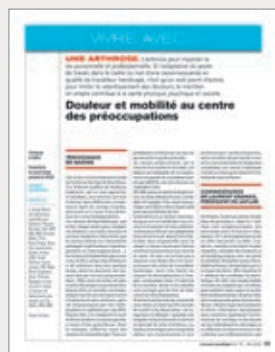
◆ Vivre avec... une arthrose (mai 2022)