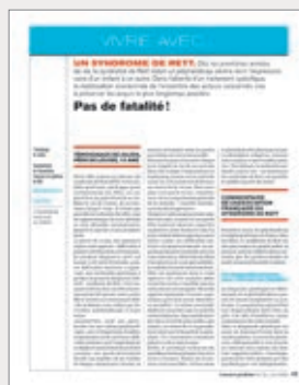
◆ Vivre avec... un syndrome de Rett (avril 2022)