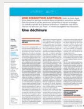
◆ Vivre avec... une dissection aortique (mars 2022)