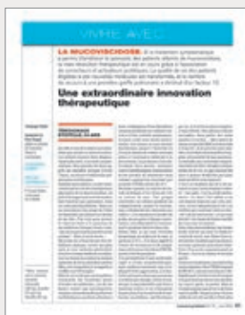
◆ Vivre avec... la mucoviscidose (juin 2022)